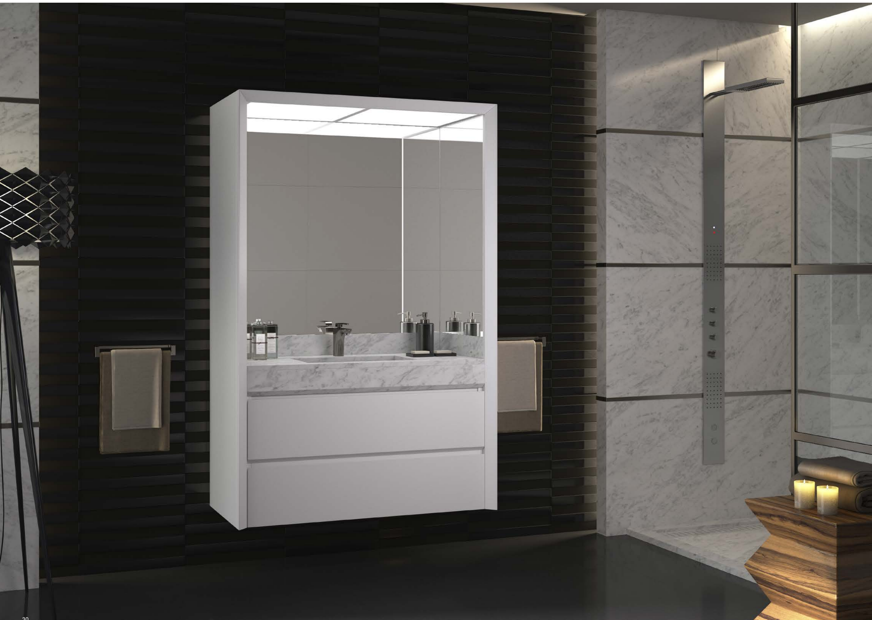
Mármol Arabescato y laca blanca. Composición compacta de 108 cm y lavabo centrado.