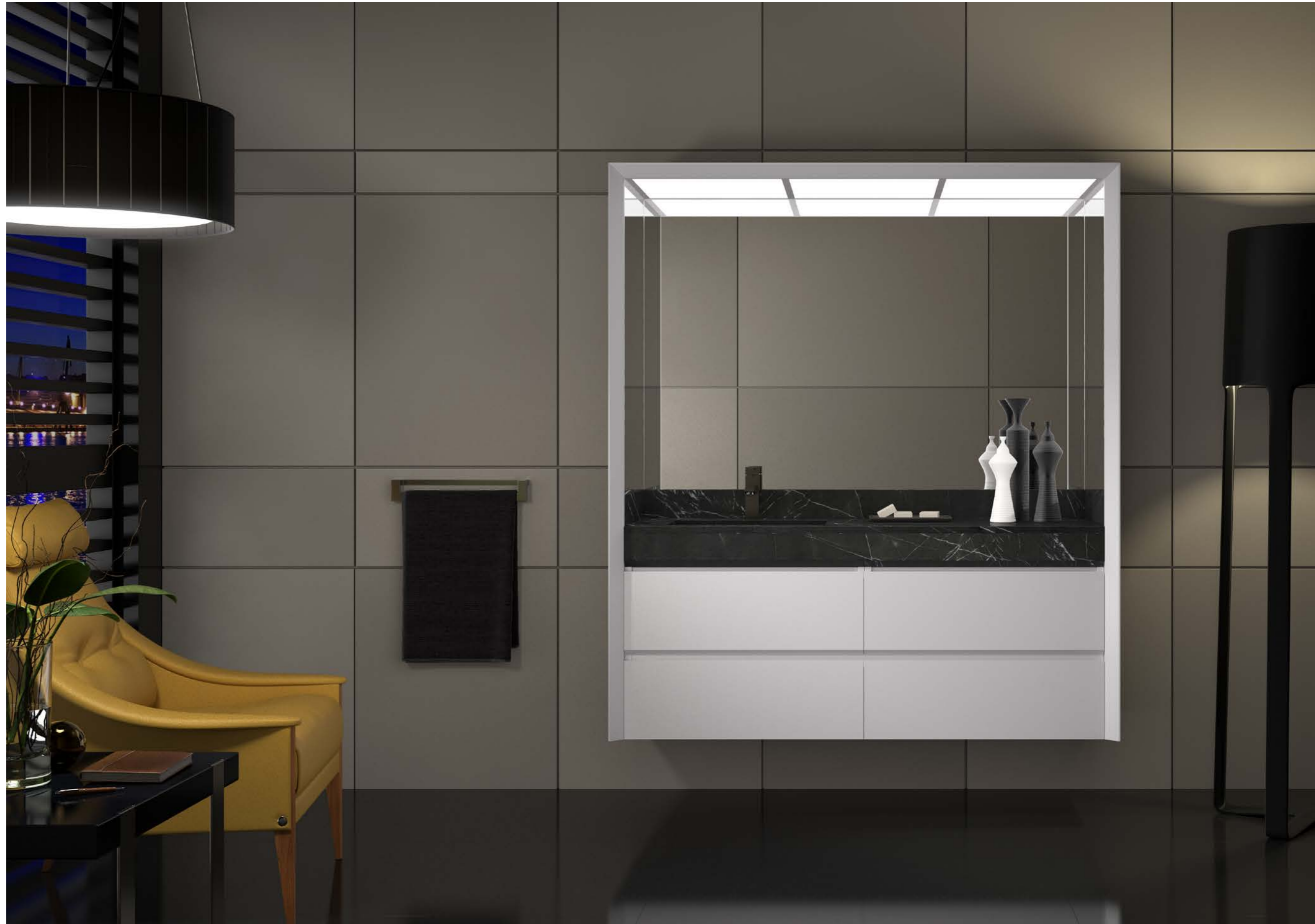
Gris Sereno y laca blanca. Composición modular de 148 cm y lavabo a la izquierda.